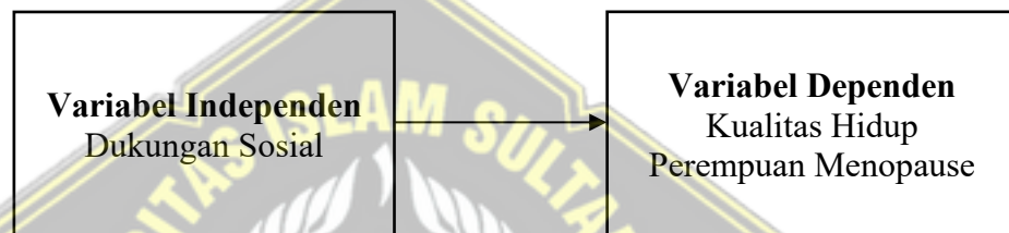
Gambar 3.1 Kerangka Konsep

Kerangka konsep adalah hubungan antara satu konsep dengan konsep lainnya serta antara satu variabel dengan variabel lainnya yang berkaitan dengan permasalahan yang akan diteliti, dijelaskan dan disajikan dalam bentuk kerangka konsep penelitian (Ningsih, 2023).