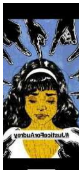
Gambar 1. Contoh kasus perundungan di platform x. 8

UU ITE menyebabkan aparat penegak hukum kesulitan menentukan batas perbuatan yang bisa dipidana, terlebih karena bukti digital sering kali bersifat rapuh.