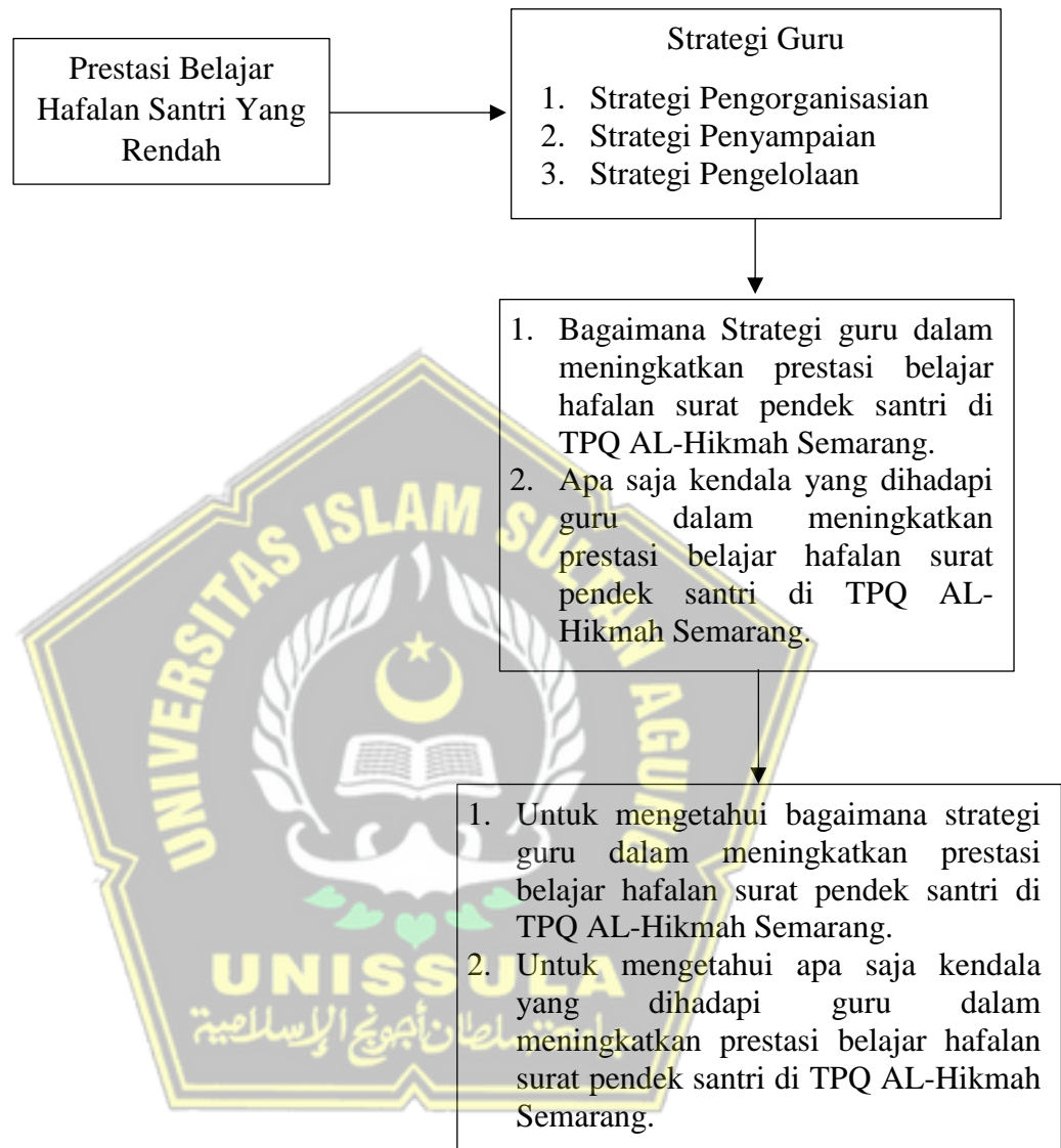
Gambar 1. Kerangka Teori