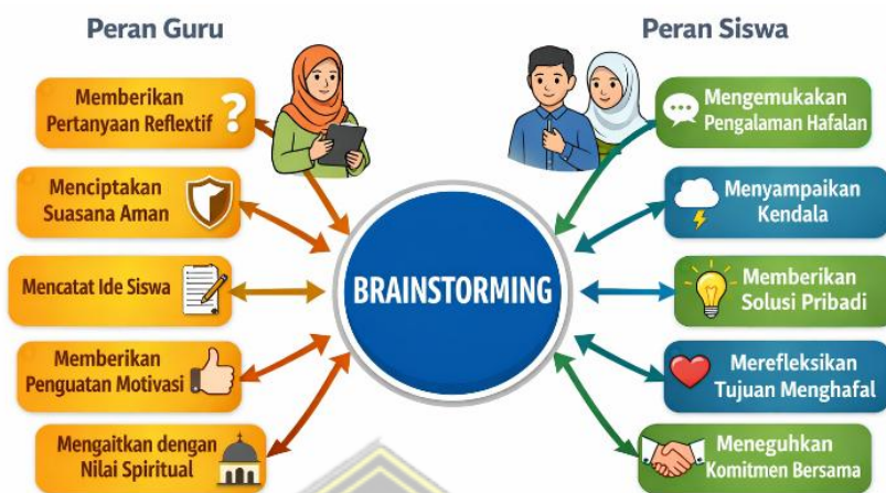
Skema Interaksi Guru dan Siswa dalam Metode Brainstorming