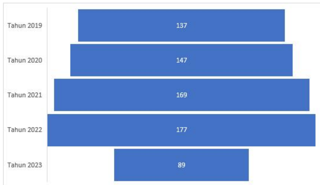
Grafik 1.1 Presentase Perkawinan Beda Agama di Indonesia Periode Tahun 2019 – Tahun 2023