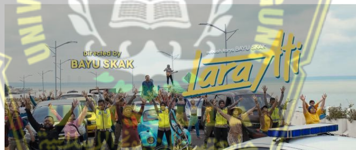
Gambar 3.3 Film Lara Ati

Sedangkan sumber data penelitian yang digunakan pada penelitian ini yaitu sumber data primer. Data primer merupakan jenis sumber data yang langsung dikumpulkan oleh peneliti dari sumber utamanya yaitu film Lara Ati yang sudah tersedia di platform streaming Netflix .