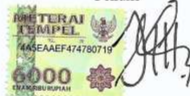
Jumar Al Isra