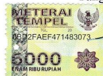
Laode Muhammad Aidil Akbar