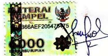
Fitriyah Qurrotul Ayni