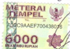
Doni Catur Saefudin