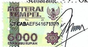
Doni Catur Saefudin