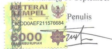
Fitria alfi Sahara