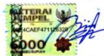
Ayu Sekar Tanjung