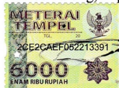
Izzuddin Asy Syadid