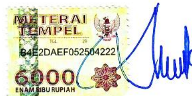
Retno Muktining Tyas