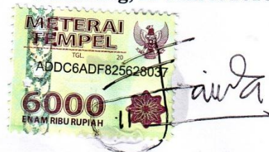
Soraya Nur Faida