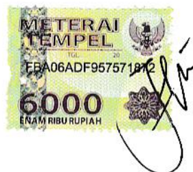
Fitri Ayu Nurani