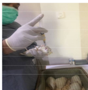
Gambar 2. Proses sonde diet tinggi kolesterol

Setelah dilakukan perlakuan selama 7 hari, pengambilan serum dilakukan pada hari ke 8. Darah diambil dari sinus orbitalis tikus sebanyak satu kali dan yang melakukan adalah peneliti, diambil dari sinus orbita karena darah yang dibutuhkan 1-3 cc dan nanti yang diambil serum darahnya. Kadar TNF \alpha diamati dengan teknik ELISA menggunakan Kit Rat TNF- \alpha didapatkan dari Laboratorium Biologi FK UNISSULA dan pada sumuran 48-well yang coating dengan antigen. Metode ELISA menggunakan rekomendasi dari WHO dengan pengulangan minimal 3 kali. Kemudian dilakukan uji analisa data menggunakan aplikasi SPSS dengan uji normalitas dan homogenitas jika data normal dan homogen uji One-way Anova.