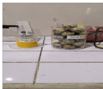
Gambar 1. Diet tinggi kolesterol

Kelompok 1 (kontrol) dipelihara dengan pakan pellet yang terstandar dan air minum berupa akuades suhu ruangan pemeliharaan berkisar 22°-24° C dengan ventilasi dan ruangan yang cukup. Kelompok ini hanya diberi pakan pellet yang terstandar dan air minum berupa akuades setiap hari tanpa adanya perlakuan diet tinggi kolesterol. Kelompok 2 (perlakuan) diberi pakan + aquabides dan diet tinggi kolesterol kolesterol setiap jam 08.00 WIB selama 7 hari dengan cara disonde. Dipilih cara sonde agar sampel mendapatkan diet tinggi kolesterol dengan kualitas dan kuantitas yang sama, serta untuk mengurangi bias, jika diberikan langsung ke kandang akan menyebabkan bias yang besar. Untuk dosis sonde diet tinggi kolesterol sebanyak 3 cc. Sebelum perlakuan, semua tikus sudah ditimbang.