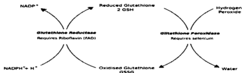
Gambar 2. Peran selenium terhadap enzim glutation peroksidase (14)

sinergi dengan vitamin E dalam menghambat proses peroksidasi lipid. Vitamin E yang teroksidasi oleh radikal bebas dapat bereaksi dengan vitamin C, setelah mendapat ion hidrogen dari vitamin C akan berubah menjadi vitamin E. Vitamin E dalam membran bereaksi dengan radikal lipid ( LOO^{\bullet} ) membentuk radikal vitamin E (vit. E ^{\bullet} ). Radikal vitamin E bereaksi dengan vitamin C membentuk radikal bebas vitamin C (vit. C ^{\bullet} ). Radikal vitamin C (vit. C ^{\bullet} ) akan mengalami regenerasi menjadi vitamin C dengan melibatkan glutation (GSH). GSH akan dioksidasi menjadi glutation teroksidasi (GSSH) oleh enzim glutation peroksidase (GPx), GSSH akan direduksi kembali menjadi bentuk GSH oleh enzim glutation reduktase (GRd) dengan melibatkan NADPH sebagai donor elektron 8,14 . L-arginin dapat mengubah radikal vitamin C menjadi vitamin C, L-arginin dalam air kelapa muda dapat meningkatkan kadar GPx pada tikus yang diinduksi timbal 17-18 .