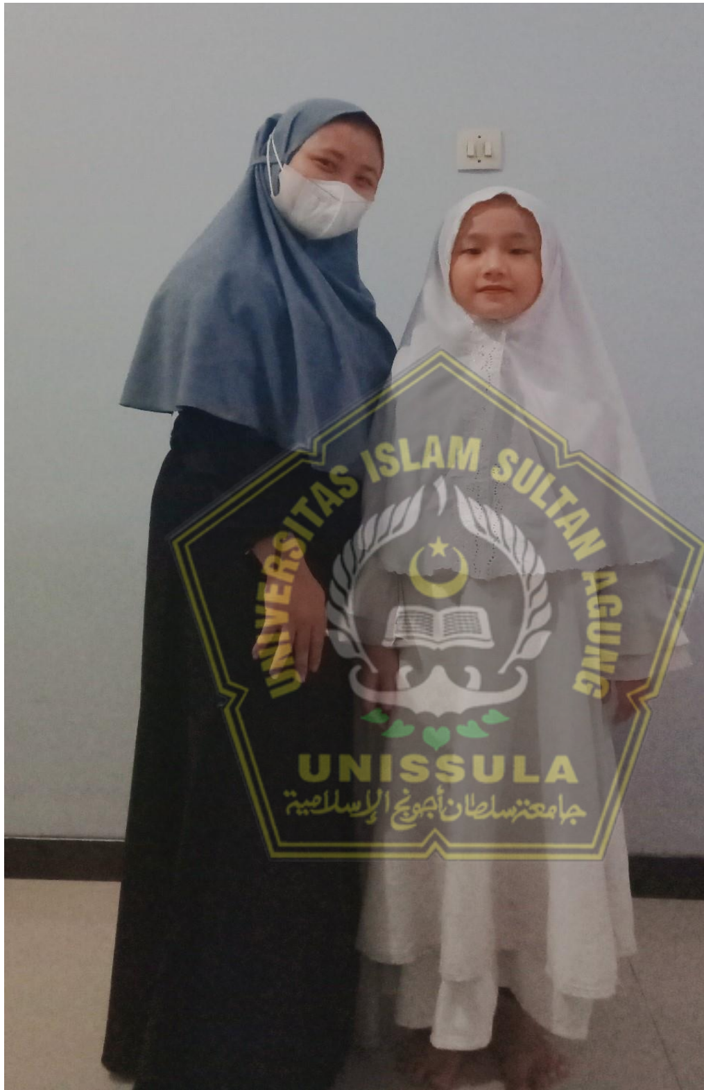
Gambar diambil setelah wawancara dengan peserta didik SDN Muktiharjo Kidul 02 Pedurungan Semarang