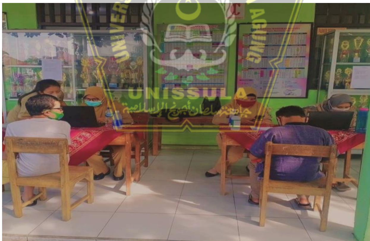
Gambar peserta didik saat mengambil tugas di Depan Kantor Guru