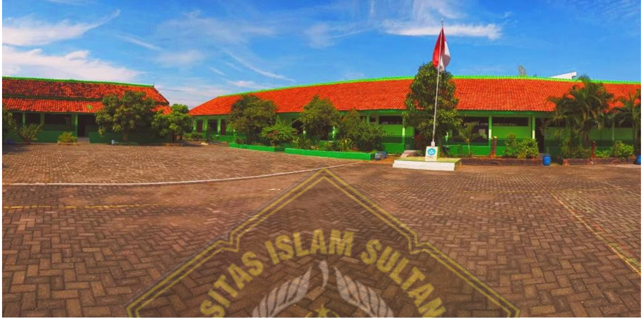
Gambar Gedung SDN Muktiharjo Kidul 02 Pedurungan Semarang