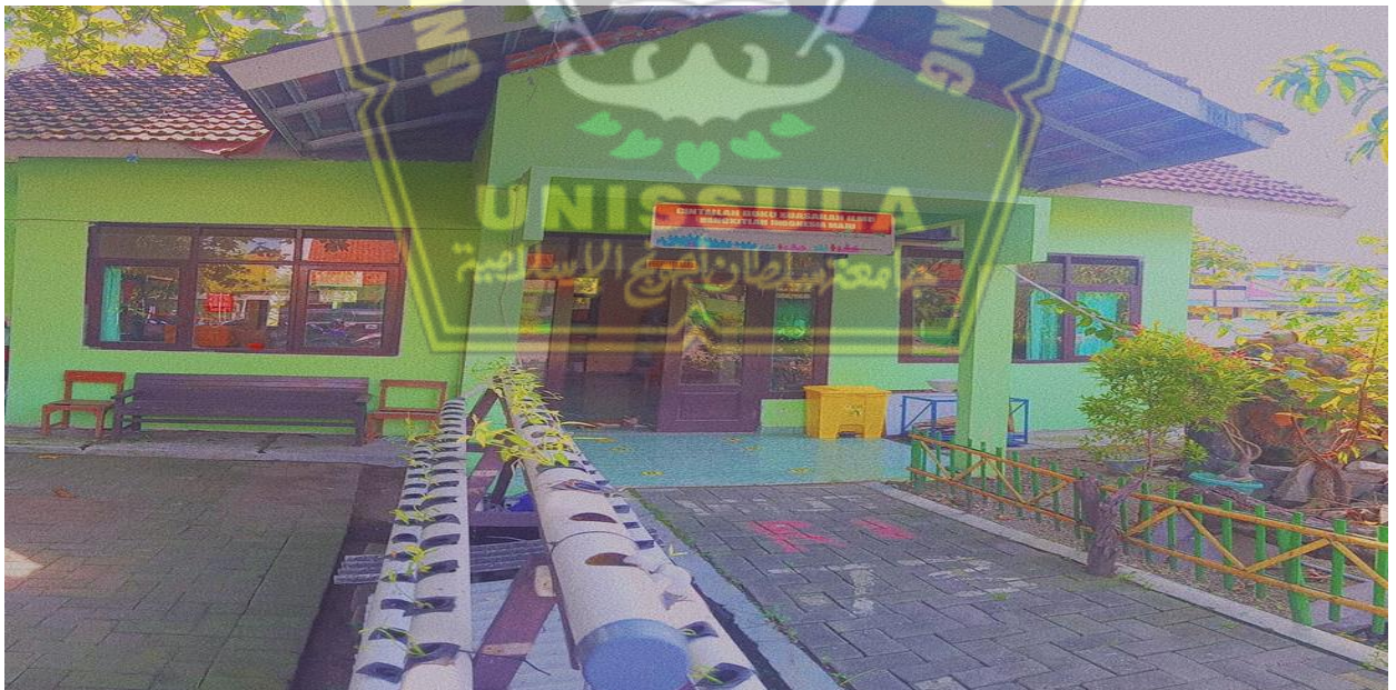
Gambar Perpustakaan SDN Muktiharjo Kidul 02