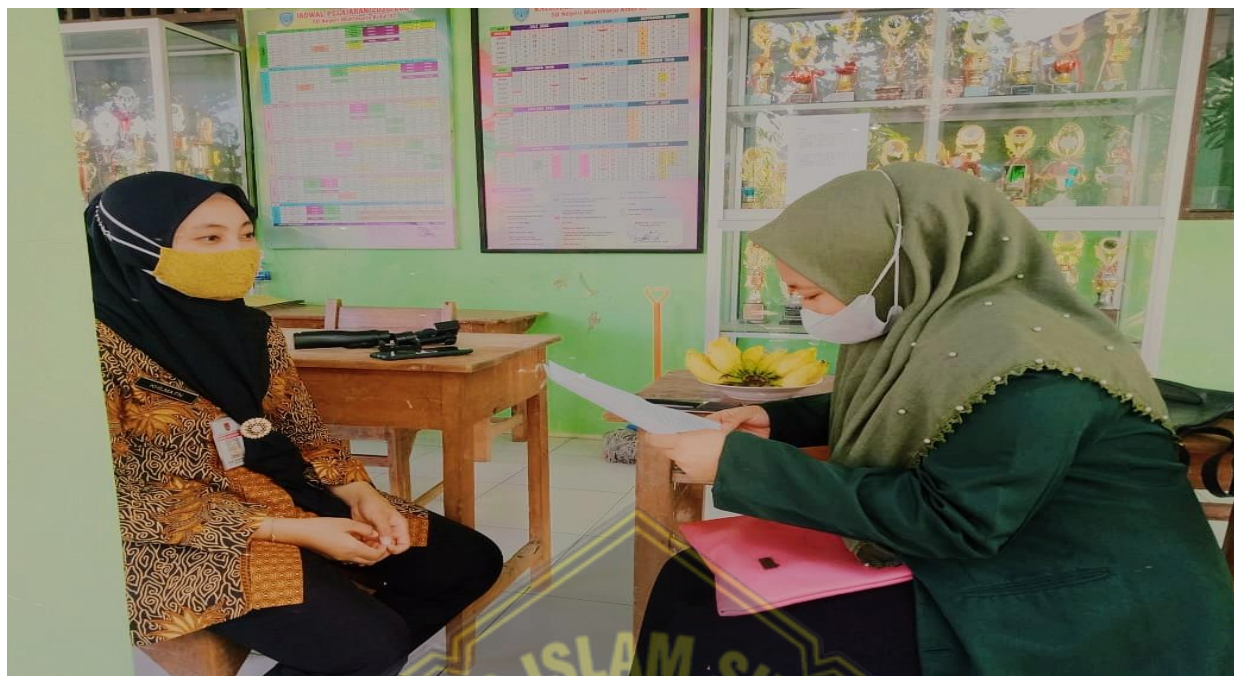
Wawancara dengan guru agama Islam SDN Muktiharjo Kidul 02 Pedurungan Semarang