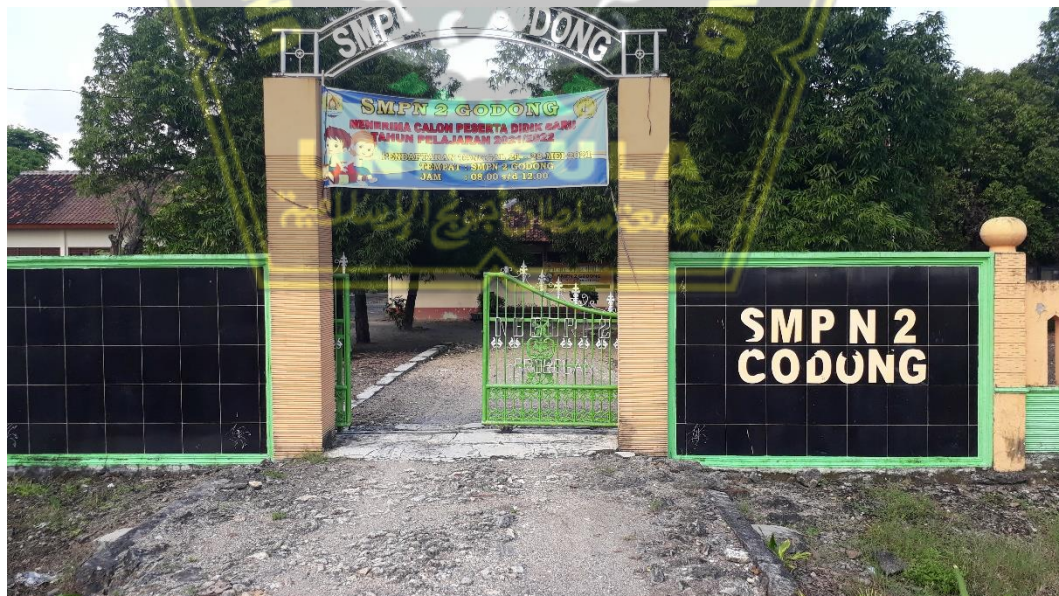
Foto gapura SMP N 2 Godong