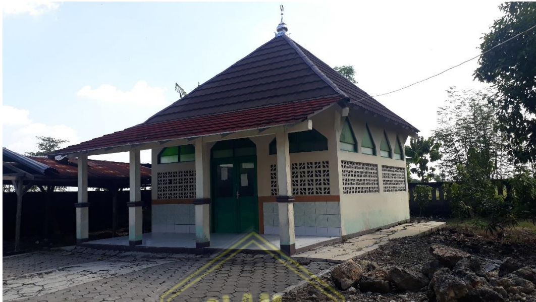
Mushola SMP N 2 Godong