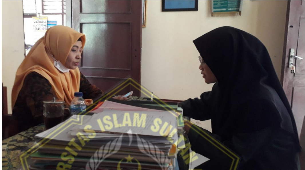
Wawancara dengan Guru PAI SMP N 2 Godong