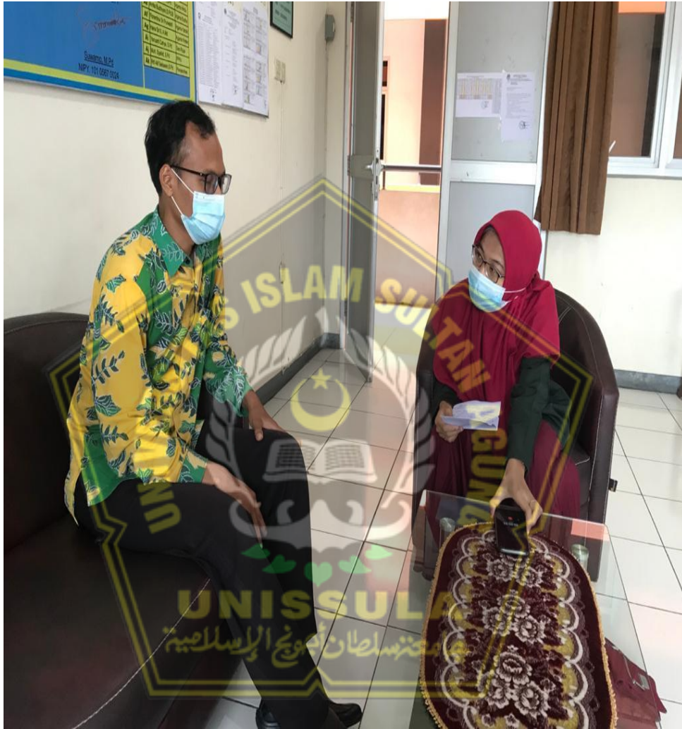
Keterangan : Foto Wawancara Dengan Guru PAI SMP Kesatrian 1 Semarang