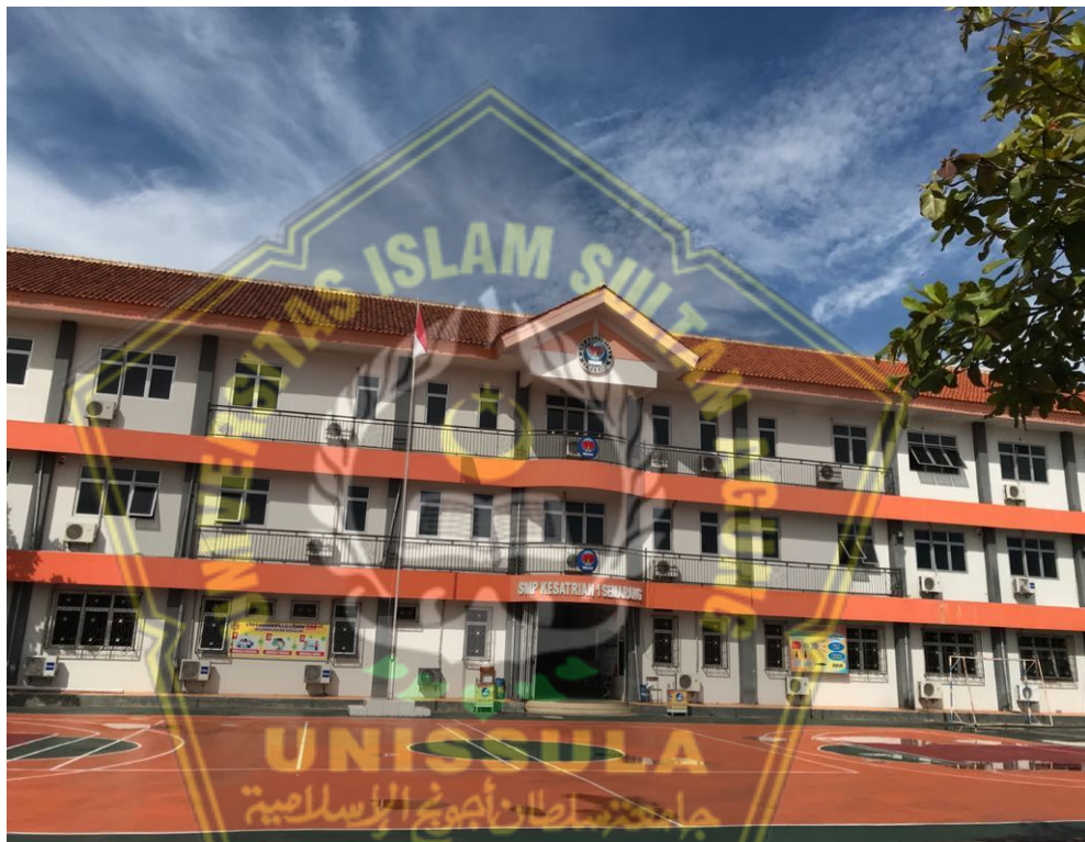
Keterangan : Gedung Sekolah SMP Kesatrian 1 Semarang