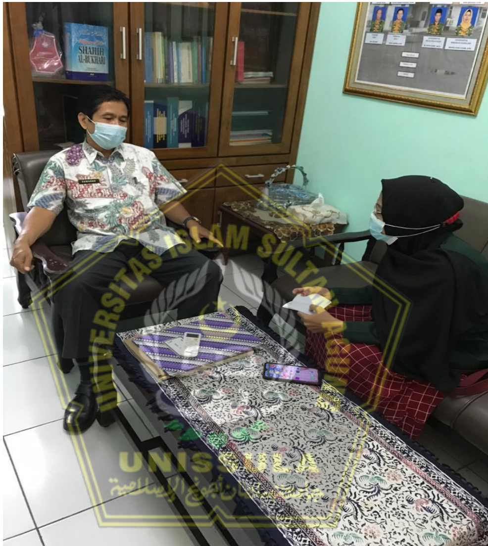
Keterangan : Foto Wawancara Dengan Kepala Sekolah SMP Kesatrian 1 Semarang