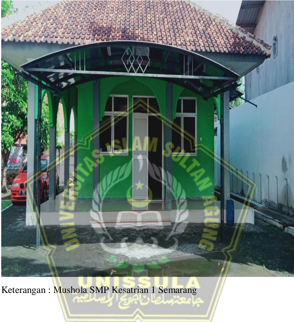
Keterangan : Mushola SMP Kesatrian 1 Semarang