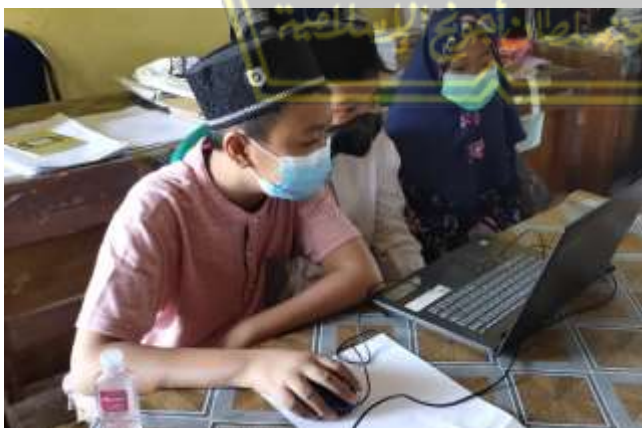
Gambar 2. Kegiatan Menonton Video Pembelajaran