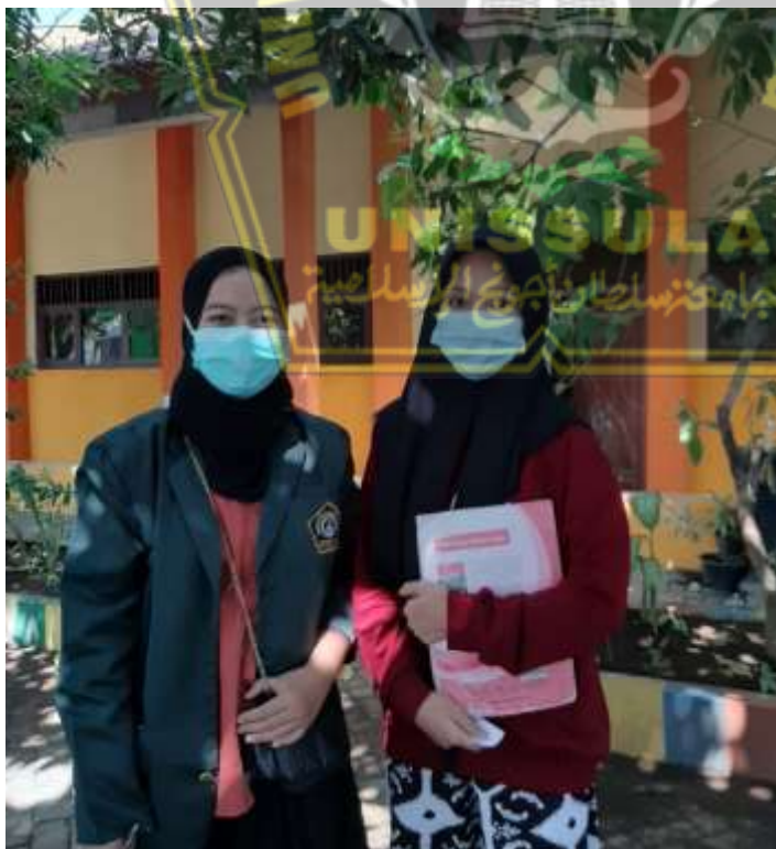
Gambar 4. Wawancara dengan peserta didik