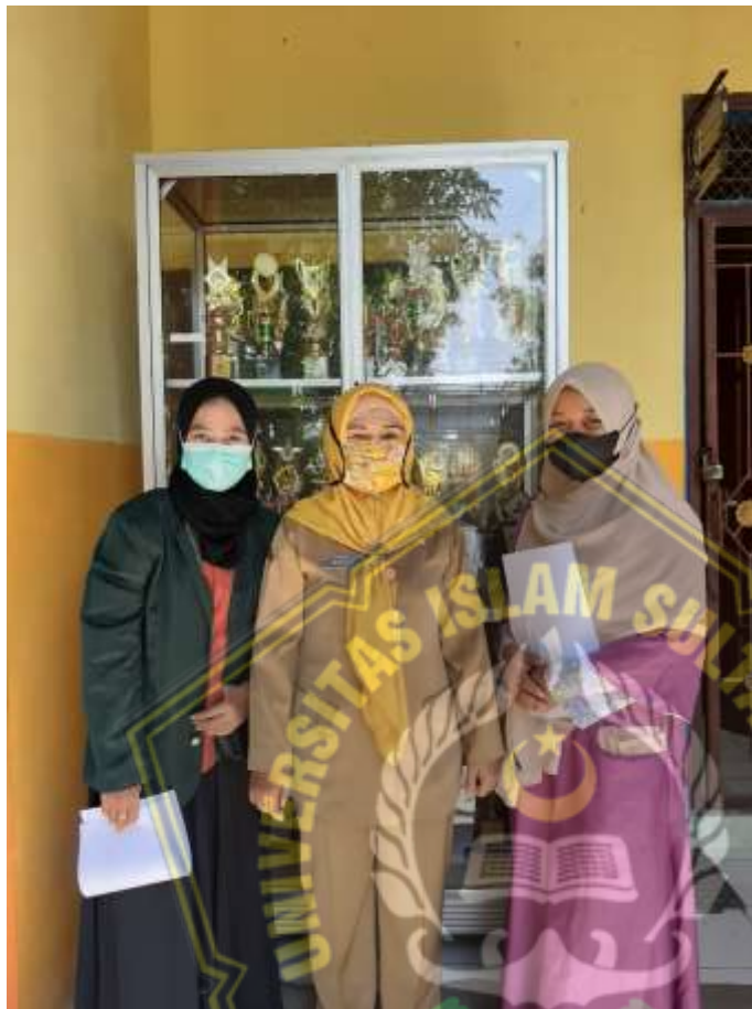
Gambar 1. Proses izin dengan kepala sekolah