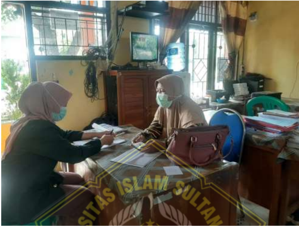
Gambar 3. Wawancara dengan Guru PAI