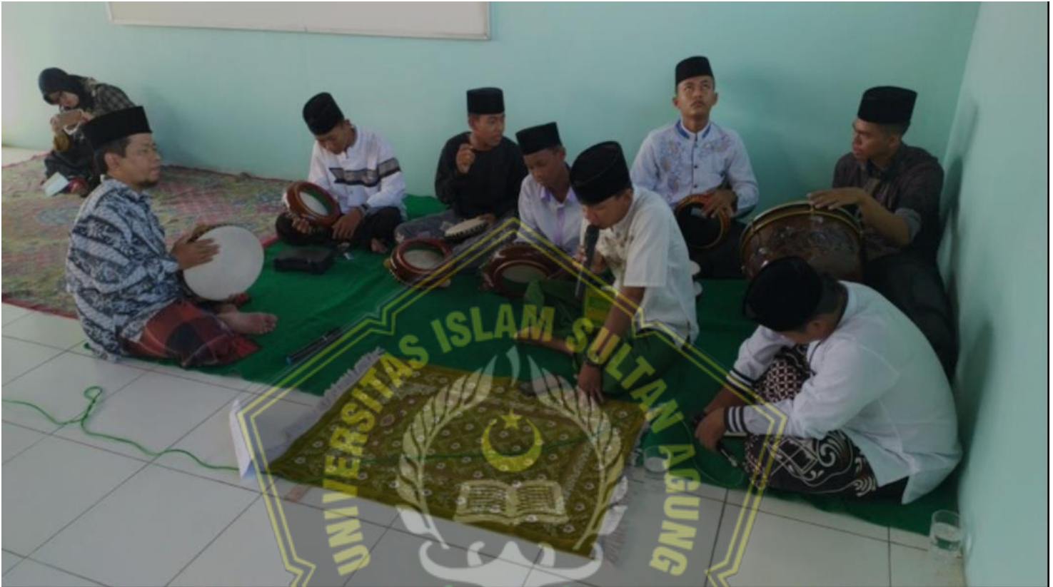
Lampiran 7. Program Extrakurikuler di SMK Islam al-Madatsir