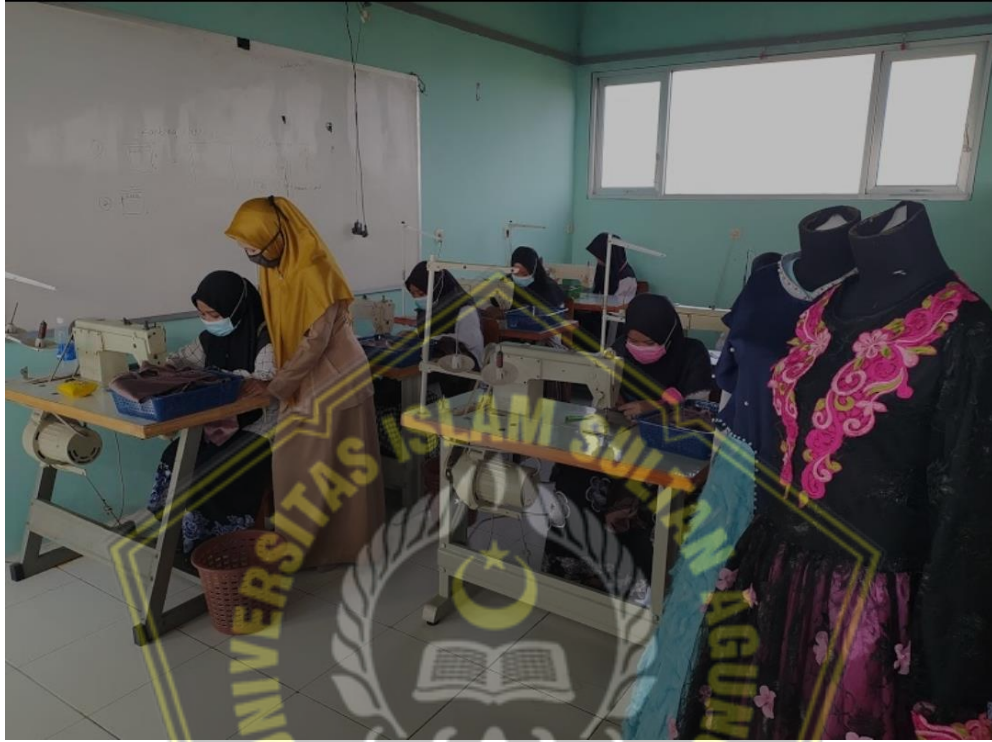
Lampiran 6. Kelas Jurusan Tata Busana SMK Islam al-Madatsir