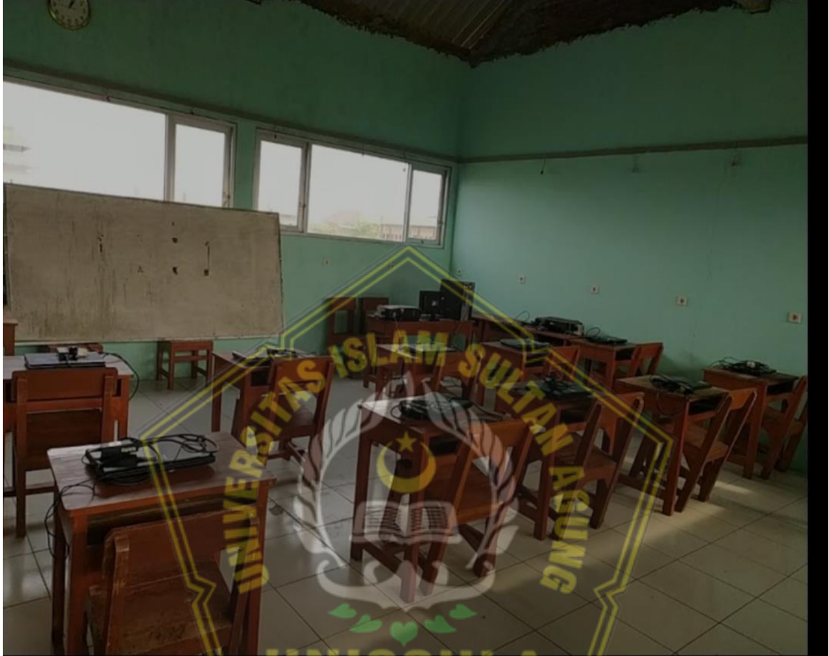
Lampiran 5. Kelas Jurusan Perkantoran SMK Islam-Madatsir