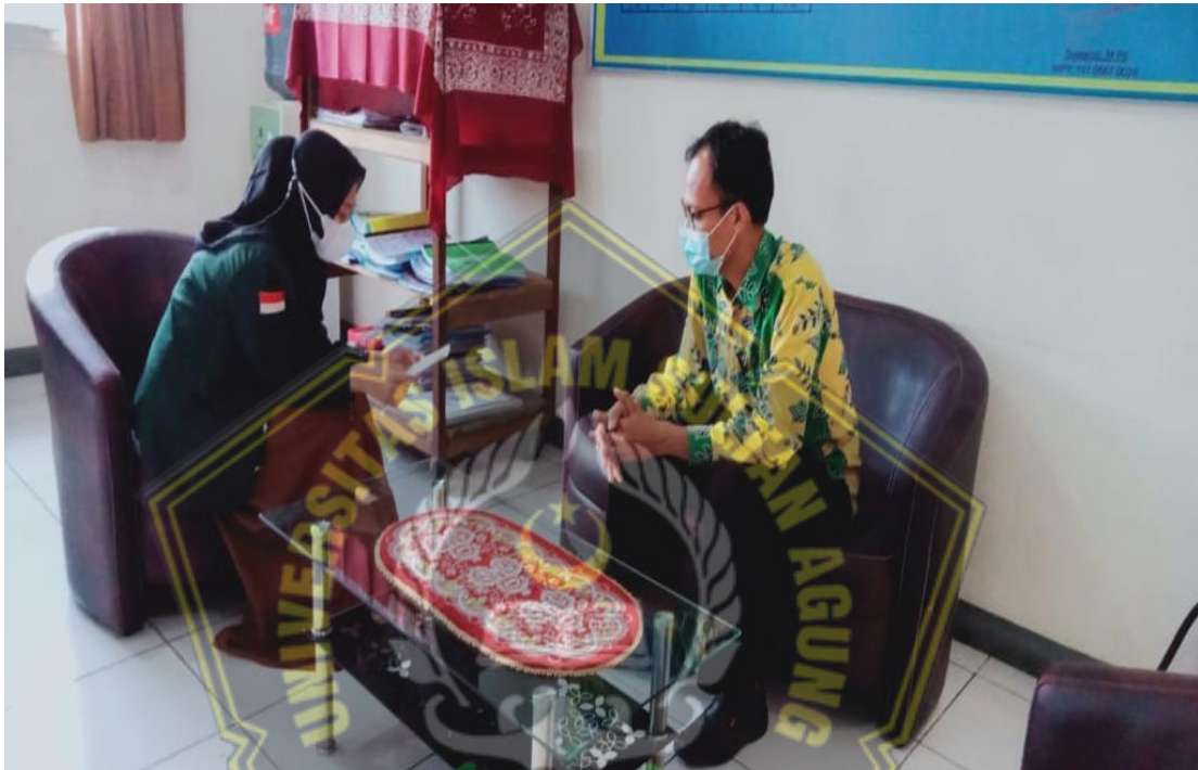
Keterangan : Foto Wawancara Dengan Guru PAI di SMP Kesatrian 1 Semarang