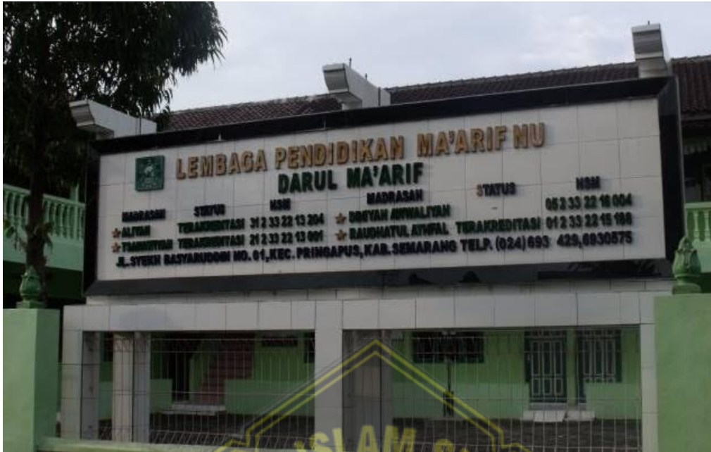
MTS Darul Ma'arif Pringapus Kabupaten Semarang