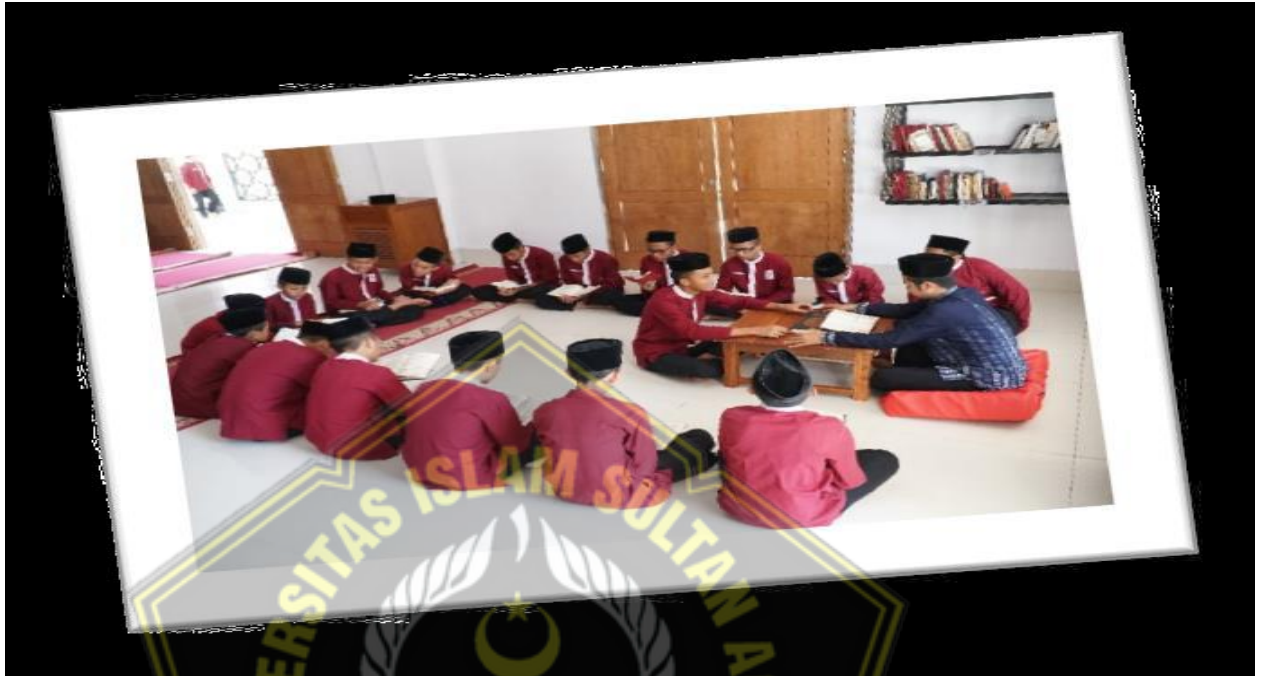
Juara MTQ Kab. Semarang