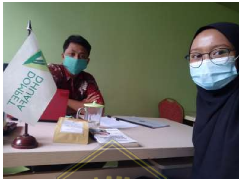
Wawancara dengan Bapak Satria Nova Dompot Dhuafa JATENG