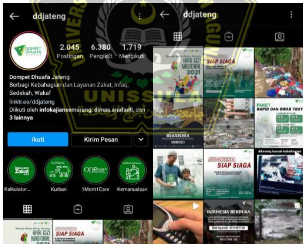
Media Sosial Instagram Dompot Dhuafa Jawa Tengah