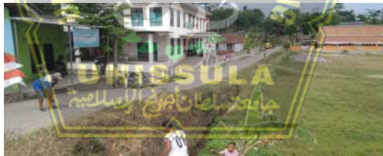
Pembangunan Gorong-gorong Drainase