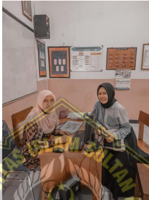
Peneliti bersama Guru Pendidikan Agama Islam setelah wawancara