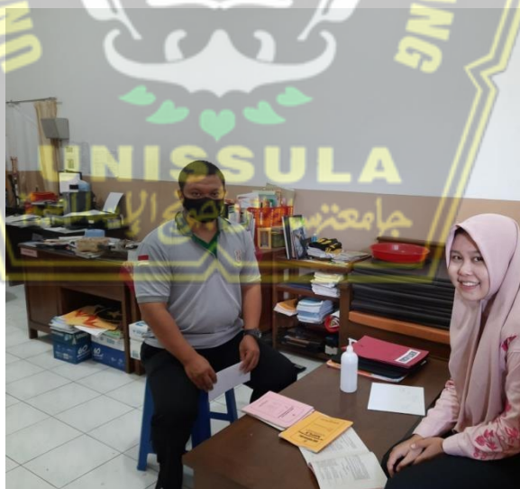
Peneliti bersama Guru Bimbingan Konseling setelah wawancara