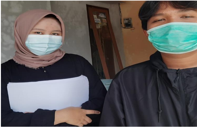
Dokumentasi dengan salah satu siswa setelah wawancara