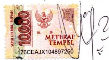
Bilal Bagus Panuntun