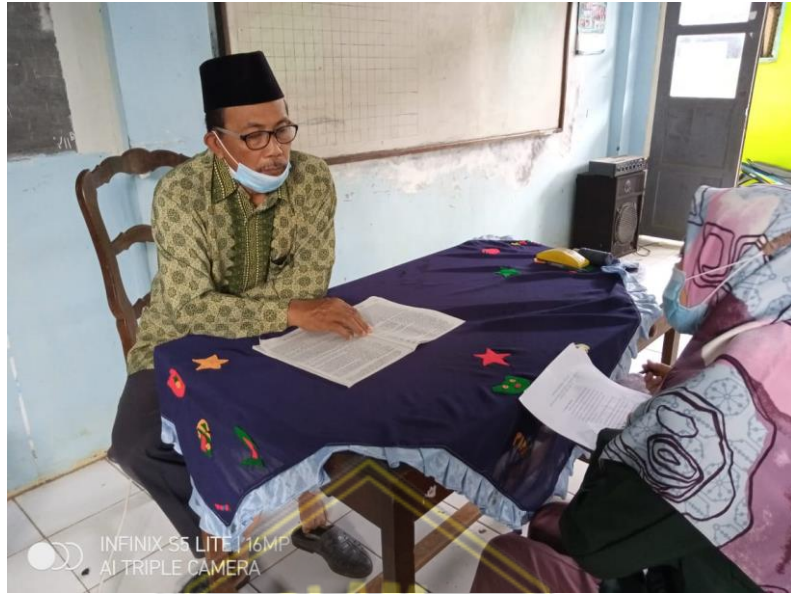
Gambar Wawancara dengan guru mata pelajaran SKI