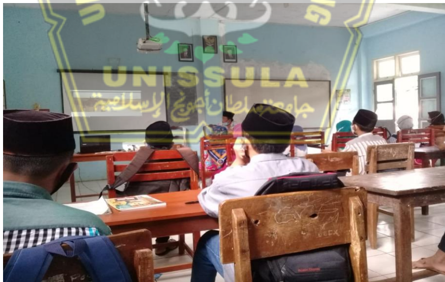
Gambar Pelaksanaan pemnfaatan media audio visual