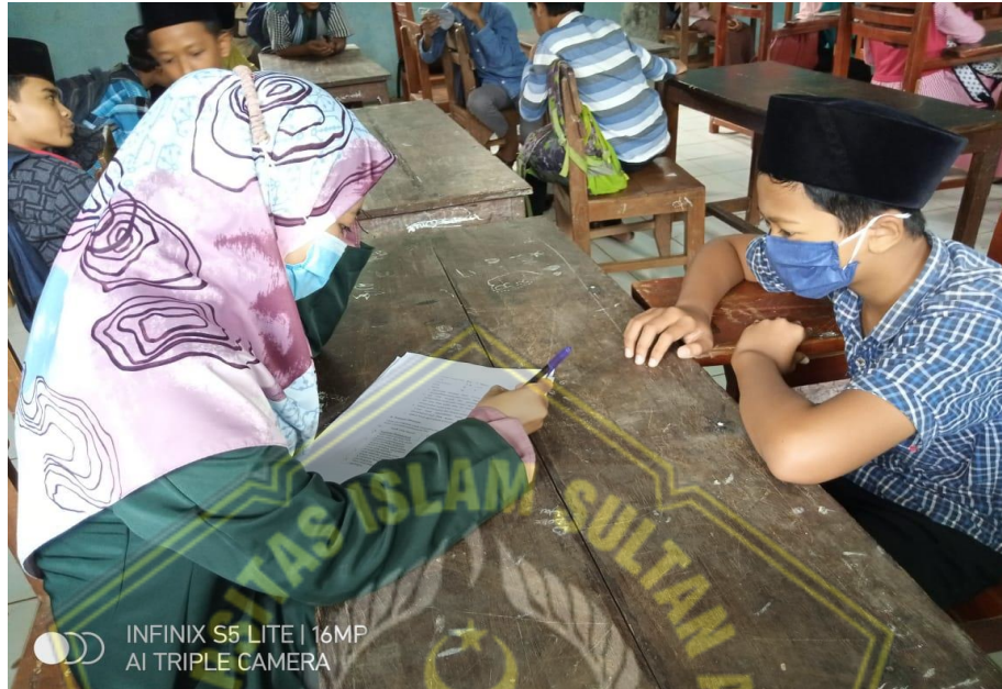
Gambar Wawancara dengan salah satu pesersta didik kelas VII