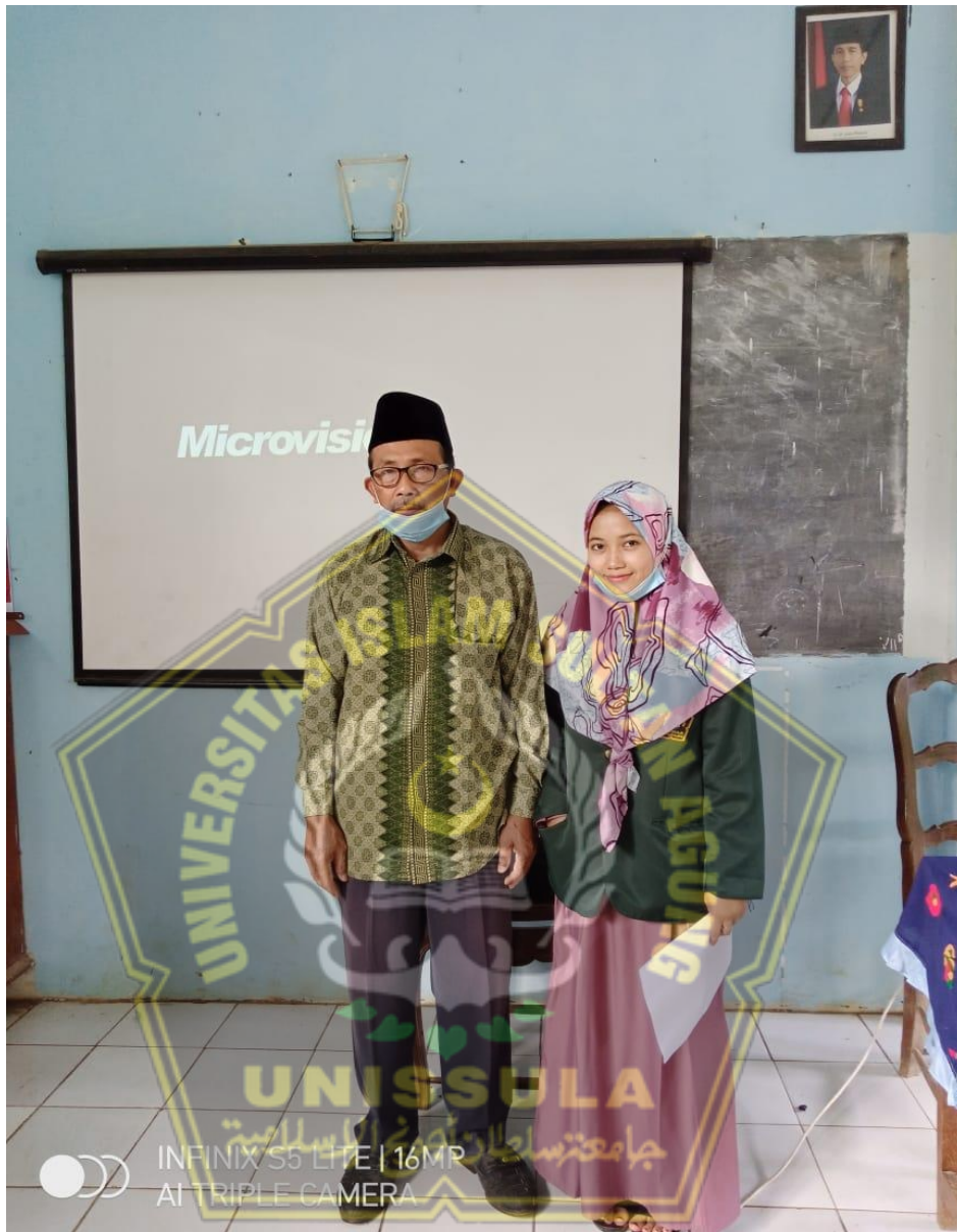
Gambar peneliti dengan guru mata pelajaran SKI setelah wawancara