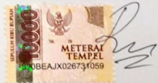
Akhmad Reza Pahlevi