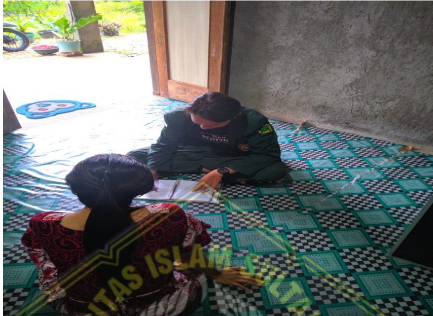
Gambar I : Wawancara dengan Responden Faktor Ketahanan Keluarga Dalam Pernikahan Dibawah Umur.