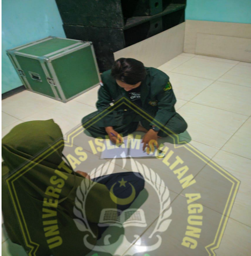
Gambar II : Wawancara dengan Responden Faktor Ketahanan Keluarga Dalam Pernikahan Dibawah Umur.