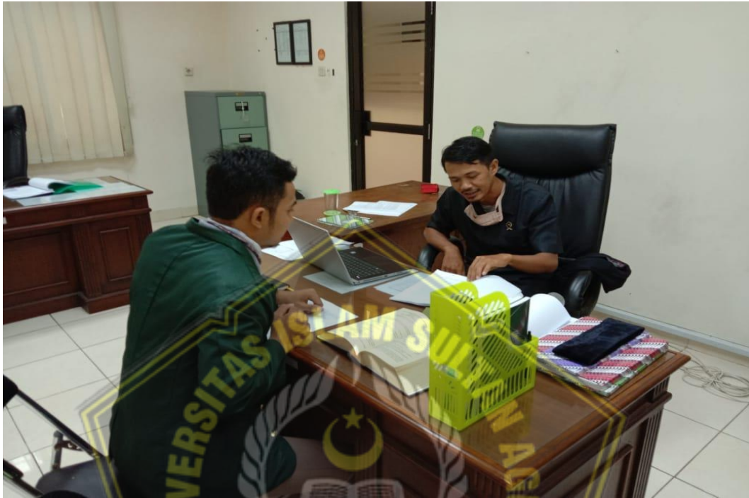
Foto Wawancara Dengan Hakim Pengadilan Agama Demak