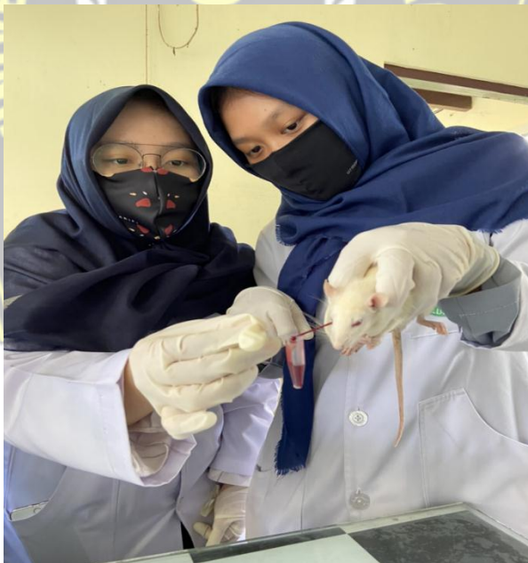
Pengambilan sampel darah dari vena orbita