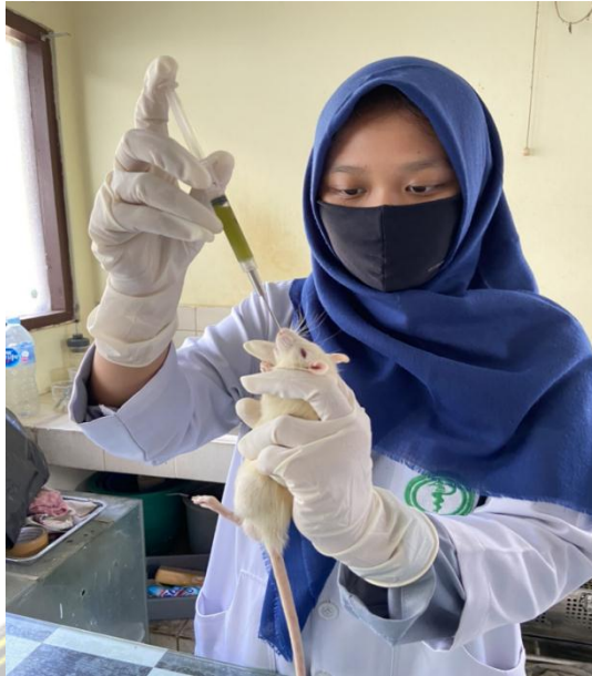
Pemberian terapi ekstrak daun kelor 100mg/KgBB/Hari