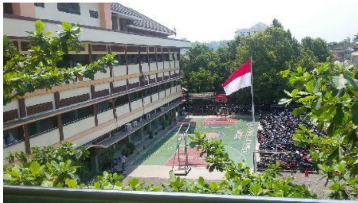
Bangunan Gedung SMA Sultan Agung 1 Semarang