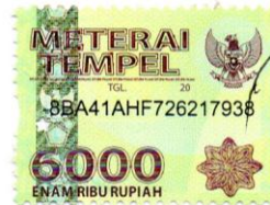
Farizky Slamet Wibowo