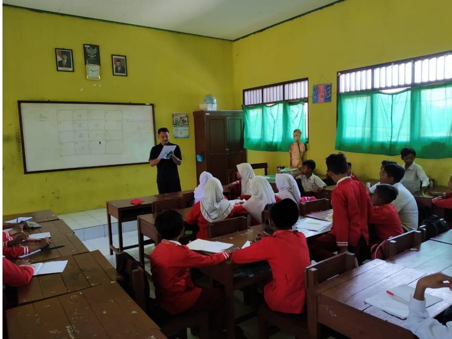
Suasana kelas Vb saat pembelajaran dimulai