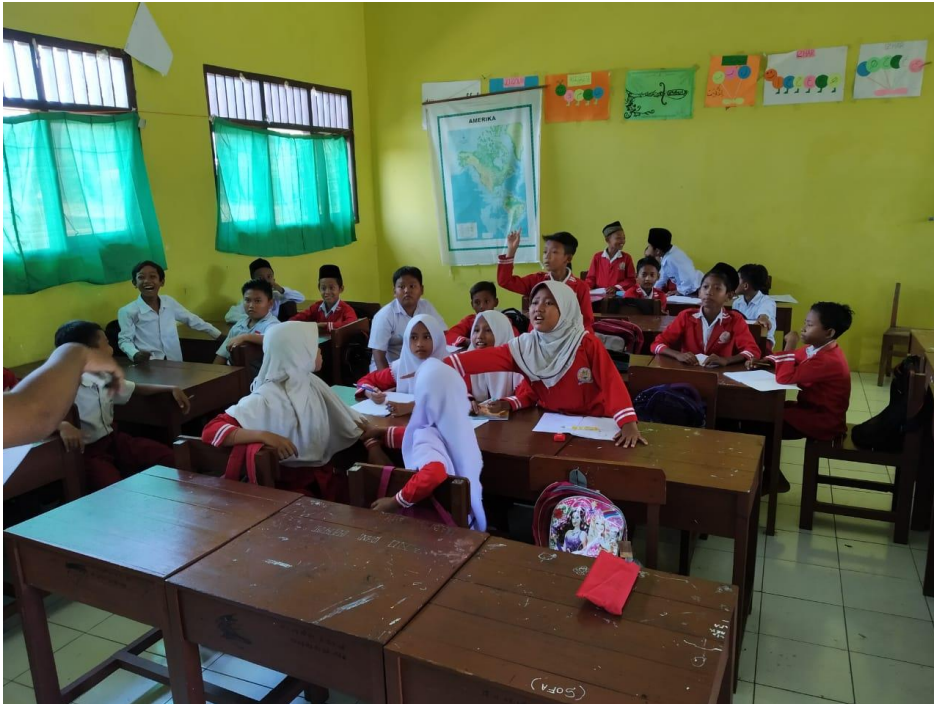
Siswa berkelompok pada model course review horay