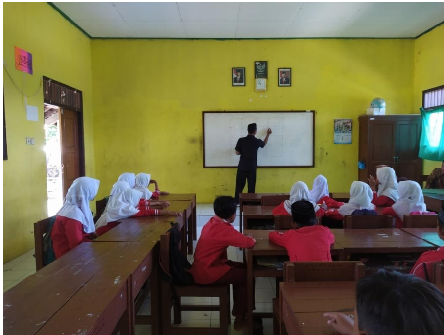
Peneliti sebagai guru menyampaikan materi pelajaran