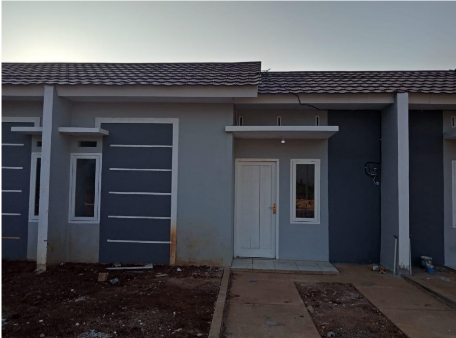
Tampak Depan Perumahan Mayong Park Residence