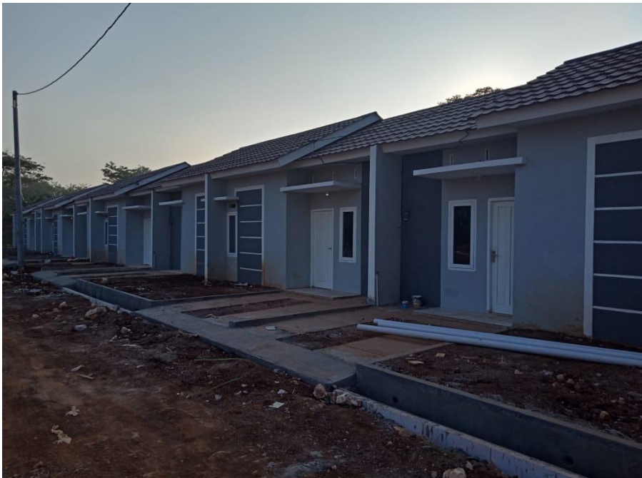
Tampak Samping Perumahan Mayong Park Residence