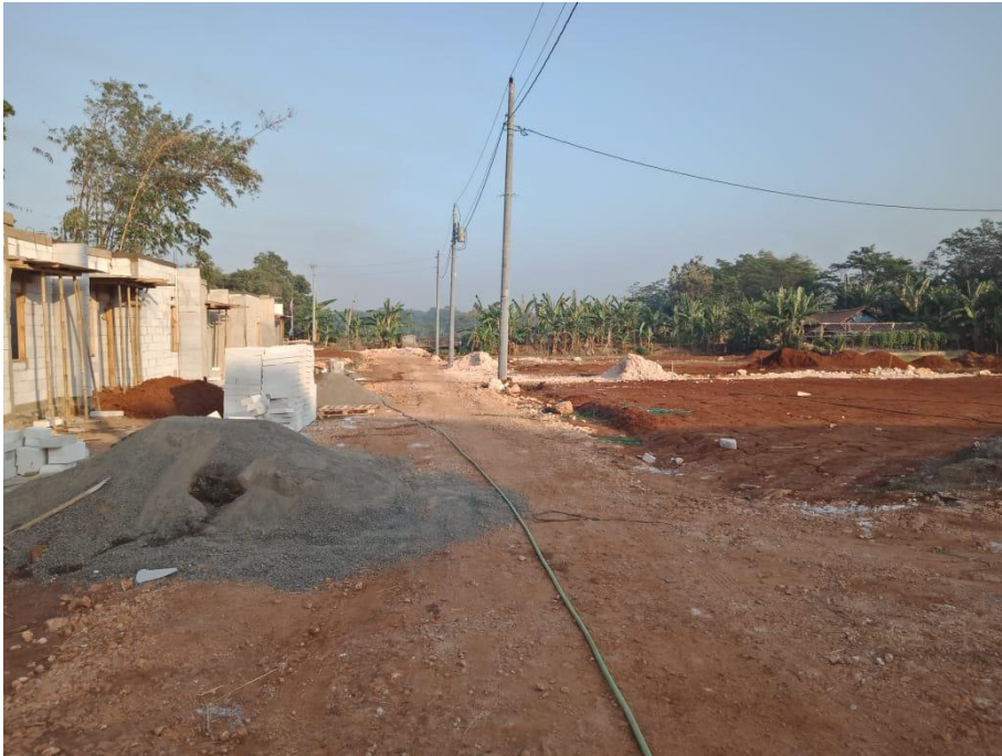
Lokasi pembangunan Perumahan Mayong Park Residence