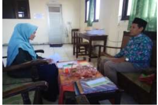
Wawancara Peneliti dengan Kepala Sekolah