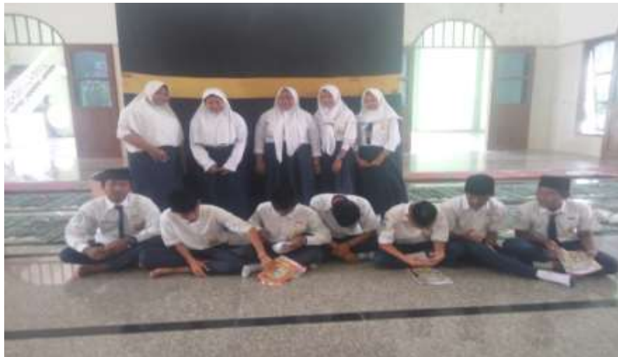
Peserta Didik kelas IX A setelah Tahليل Bersama