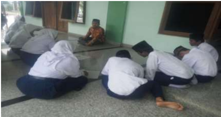
Peserta Didik Melakukan Praktik Tahليل Bersama di Masjid dan dipimpin oleh Pendidik Mata Pelajaran Fikih