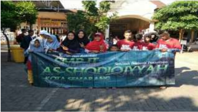
Peserta Didik setelah Ziarah Kubur