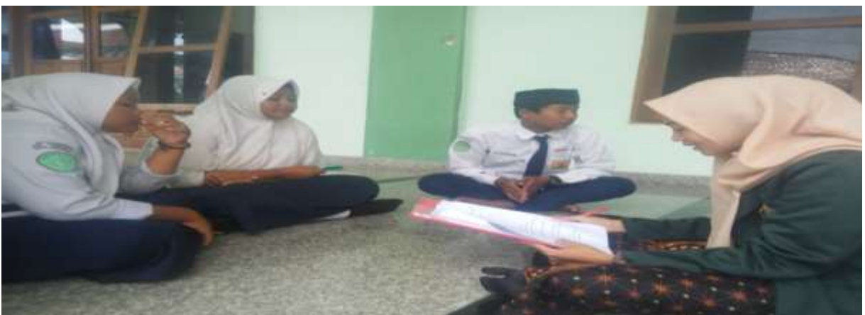
Wawancara Peneliti dengan Peserta Didik