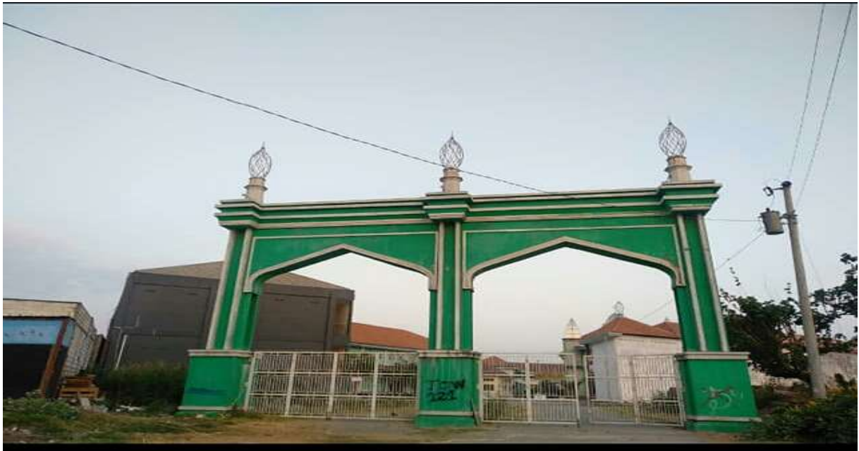
Gerbang Masuk Yayasan Asshodiyyah