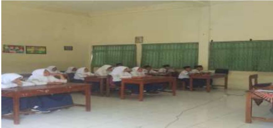
Kegiatan Pembelajaran di Kelas Peserta Didik Memperhatikan Penjelasan Pendidik Terkait Materi Ziarah Kubur