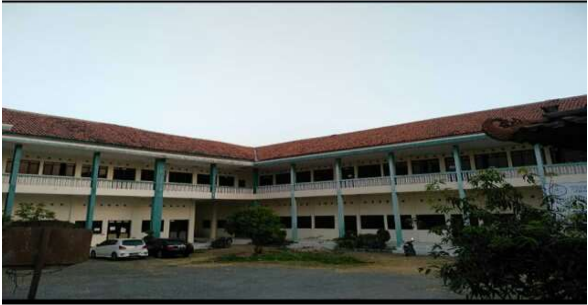
Gedung Sekolah SMP IT Asshodiyyah Semarang