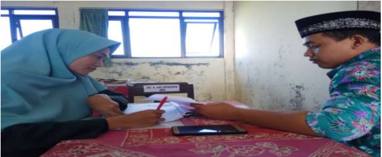
Wawancara Peneliti dengan Pendidik Mata Pelajaran Fiqih