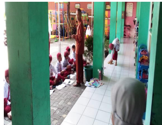
Suasana pembelajaran di luar kelas