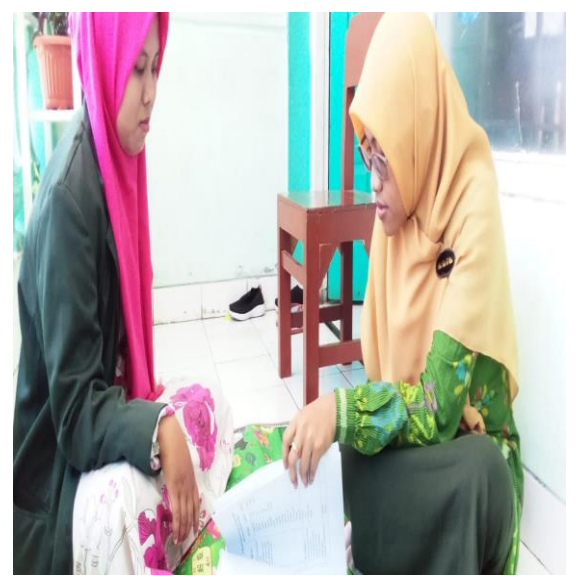
dokumentasi wawancara dengan guru wali kelas5A