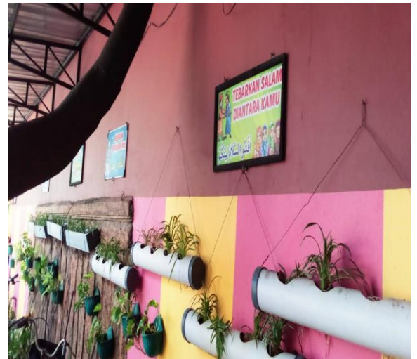
Sarana dan prasarana SD Islam Plus Muhajirin Kecamatan Genuk Kota Semarang