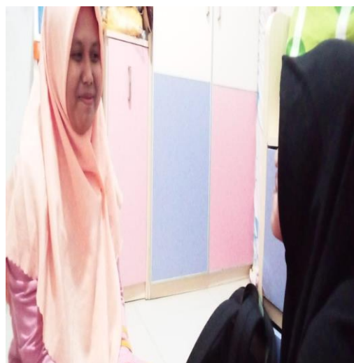
Dokumentasi wawancara dengan wali peserta didik dan peserta didik