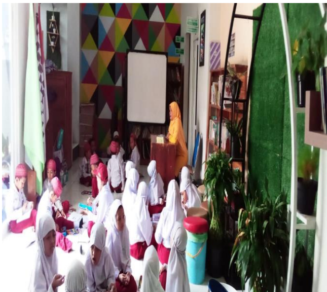
Suasana pembelajaran di aula sekolah