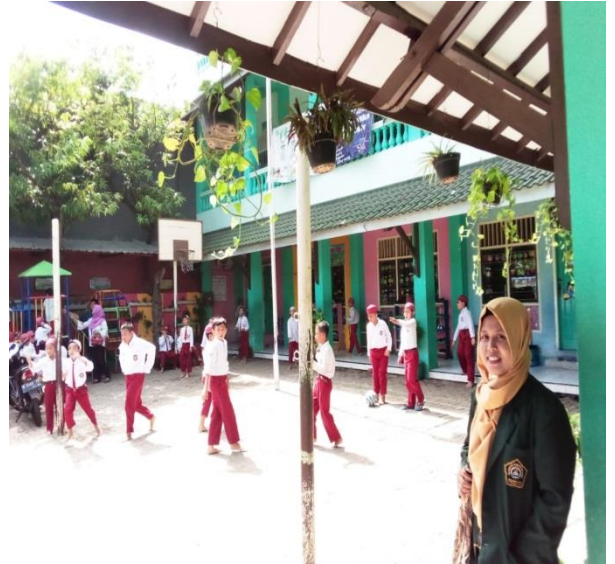
SD Islam Plus Muhajirin tampak depan & dokumentasi wawancara dengan guru PAI