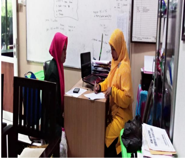
Wawancara dengan kepala sekolah dalam kelas