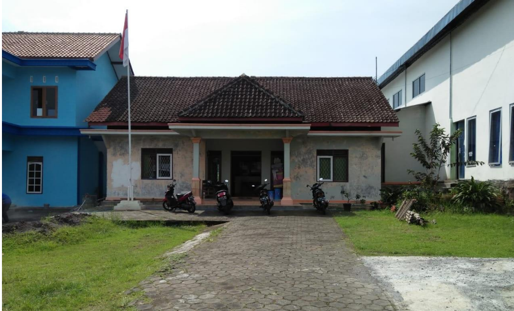
Foto Saat Wawancara dengan Kaur Desa Pagersari