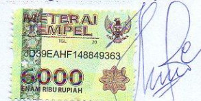
Septiana Hidayatus Saputri