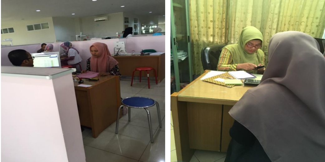
Setelah menghubungi terlebih dahulu peneliti bertemu dengan subyek penelitian