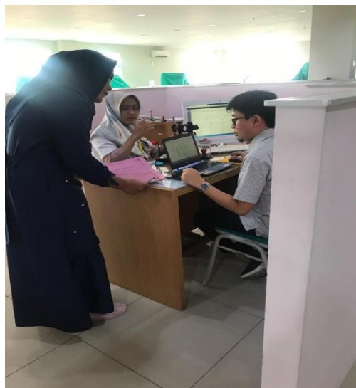
Peneliti menjelaskan terlebih dahulu mengenai garis besar penelitian