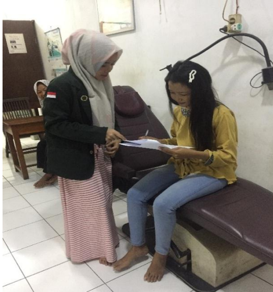
Gambar 2. Wawancara dan Pengisian Kuesioner Di Salon Jasa Kawat Gigi Semarang