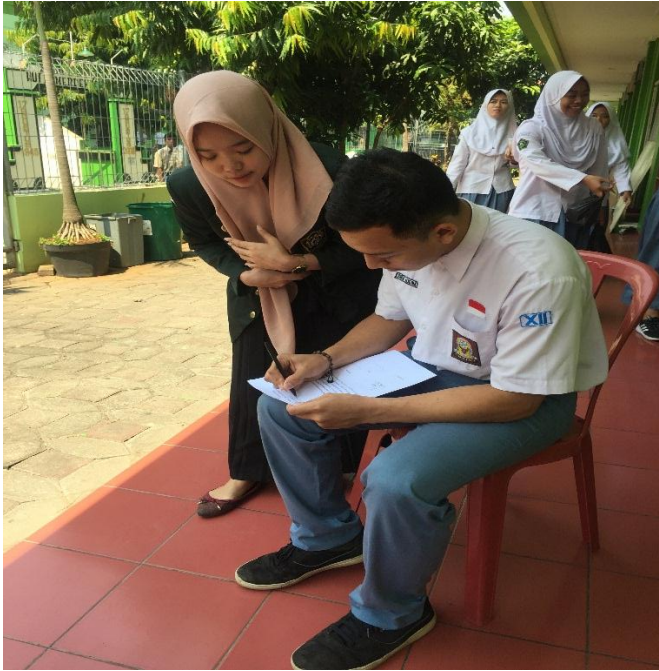
Gambar 4. Wawancara dan Pengisian Kuesioner Pada Mahasiswa Pati