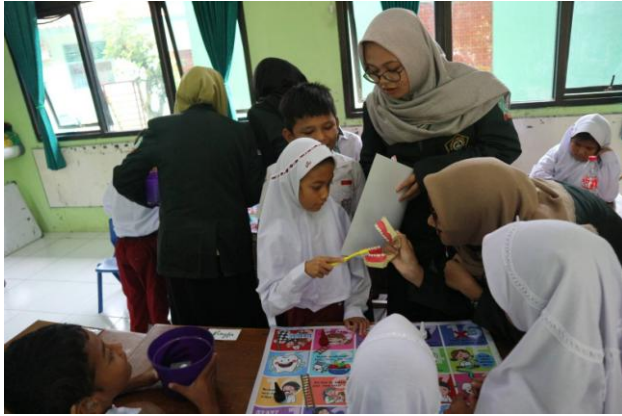
Anak disabilitas rungu mempraktikkan cara menyikat gigi dengan menggunakan phantom