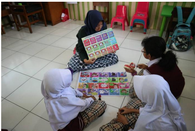
Penyuluhan cara menjaga kebersihan gigi dan mulut dengan permainan ular tangga