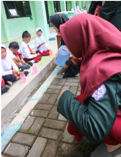
Sikat gigi bersama