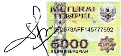
Silfia Fiky Azzahra