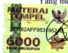
Gana Genitifa Gandhi