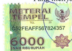
Ika Bagus Lestiyanto