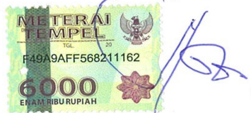
Ika Bagus Lestiyanto