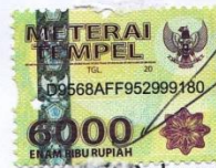
Arif Prabowo 'Ajib